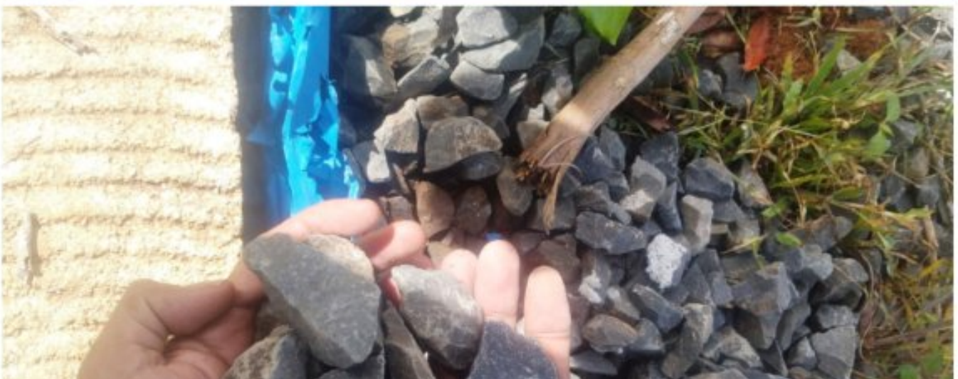
Rabat beton pekon batu kabayan

Lampung Barat - Pelaksanaan pembangunan jalan rabat beton dengan ukuran panjang 53,3 meter lebar 2 meter dan tebal 15 cm yang berlokasi dipekon batu kabayan kec. batu tulis kabupaten lampung barat yang bersumber dari dana